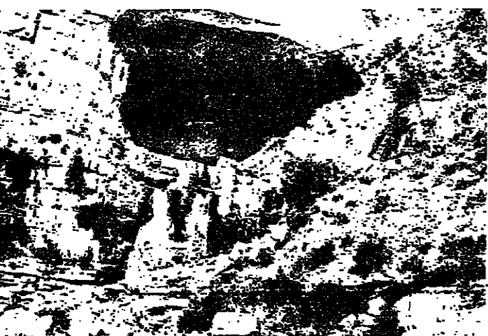
لمغارة افقا تاريخها المرفوف

يعني المياه المتجمدة من الصخر، وكما ترى لهذه هي مغارة افقا الشهيرة، وهذه شلالاتها توزع المياه على قرى قضاء جبيل ومعظم قرى قضاء كسروان منها في بيوتنا، لقد اخذوا بنا ما عندنا ولم تعط اي شيء، حتى مما اخذوه، لكن انا كبر ان تصل المياه الى بيوتنا في هذا العهد، وقد اشقت وزارة الموارد الخزانة ومحنة لفضح ومسدد التساؤل، وعمالها يصلون لانهاء المشروع. لم تعرف على وزارة التربية وماذا عن المدارس 7 مرة اخرى، يتهدد المخزن ويقول: لسوء الحظ، لم تعرف على وزارة التربية بعد، فلا مدرسة عندنا ولو بدائية، وليس